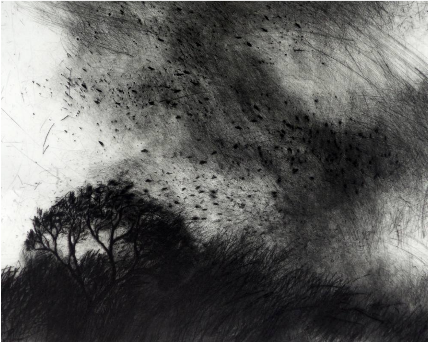
Paysage XI – Gravure sur plexiglas