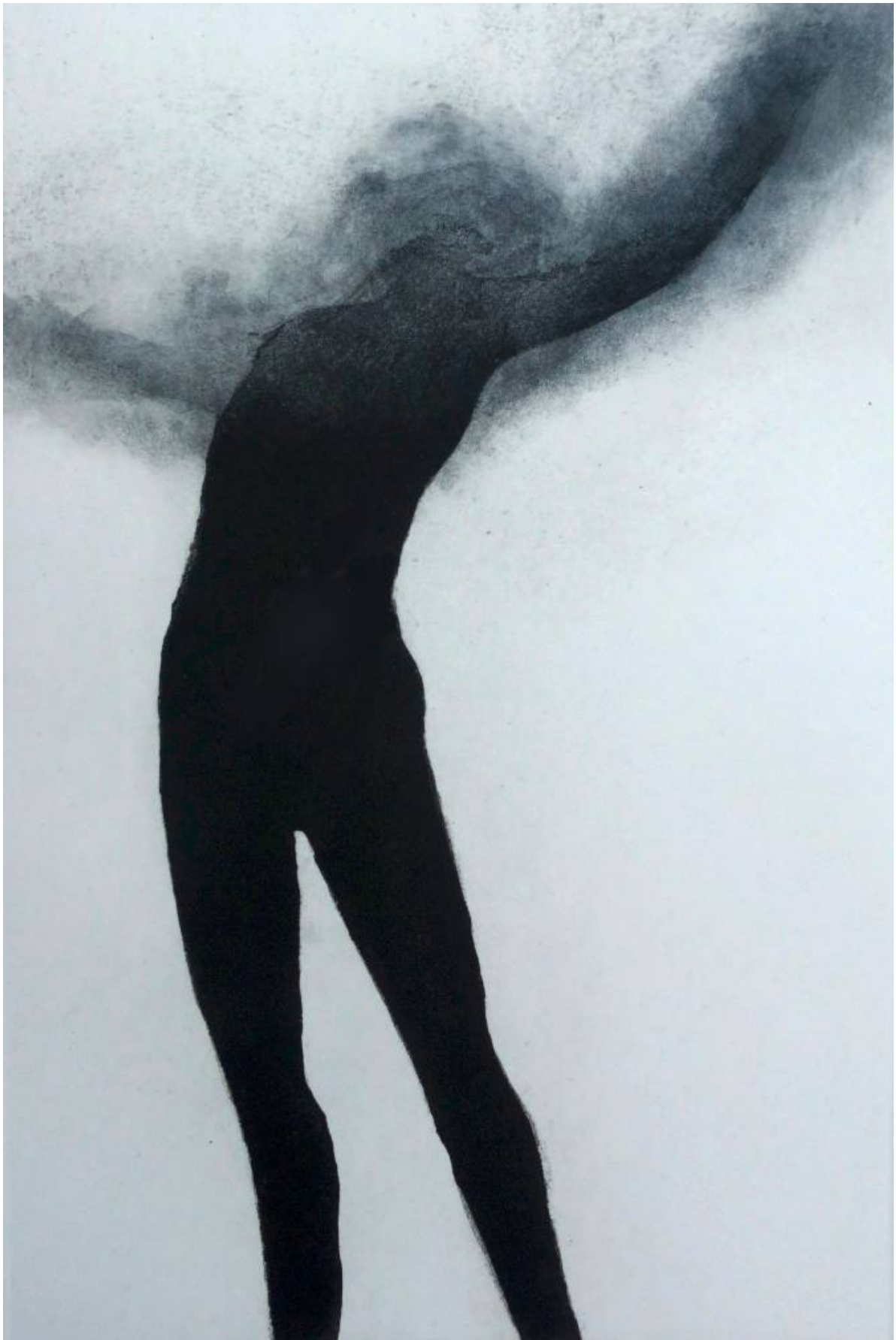
Embrasser – eau forte, plaque 20 x 30 cm