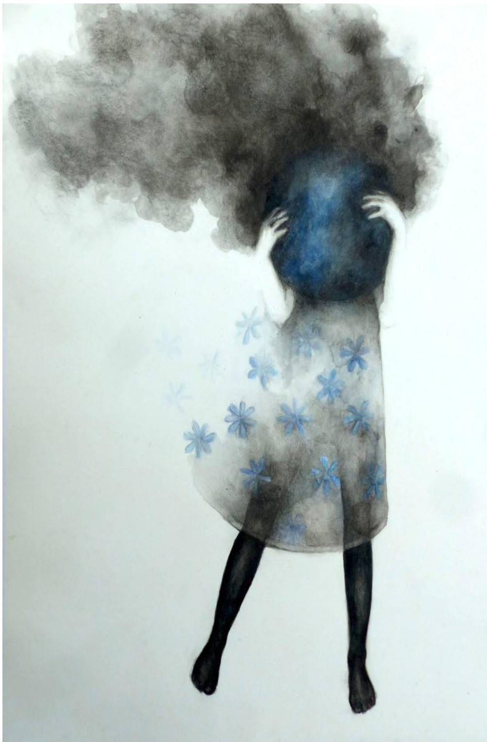
Jeu – Dessin, encre, fusain et aquarelle, 40 x 50 cm

Projet réalisé avec le soutien de l'Oreille en Friche et de la DAAC Isère.