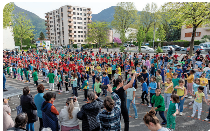
Plus de 530 élèves à la danse de la SOP!

La 2 ème semaine a débuté par la danse de la SOP sous la halle du marché Cachin et s'est poursuivie avec des rencontres et échanges avec des sportifs de haut niveau. Enfin, ces 2 semaines festives ont été clôturées le vendredi 12 avril par le courseton de l'école Pont du Drac.