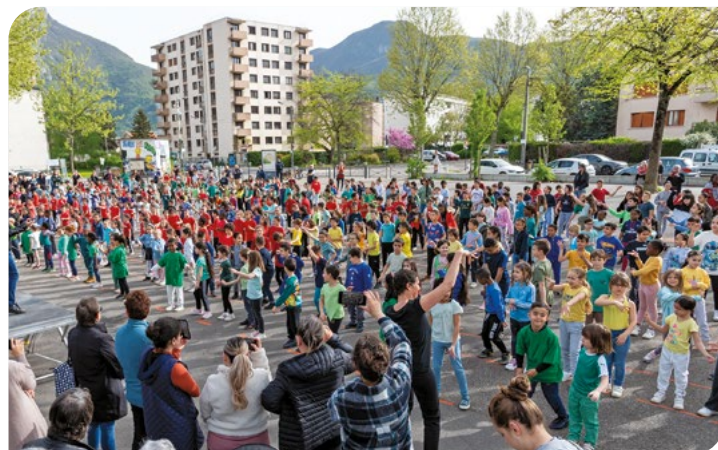
Plus de 530 élèves à la danse de la SOP!

La 2 ème semaine a débuté par la danse de la SOP sous la halle du marché Cachin et s'est poursuivie avec des rencontres et échanges avec des sportifs de haut niveau. Enfin, ces 2 semaines festives ont été clôturées le vendredi 12 avril par le courseton de l'école Pont du Drac.