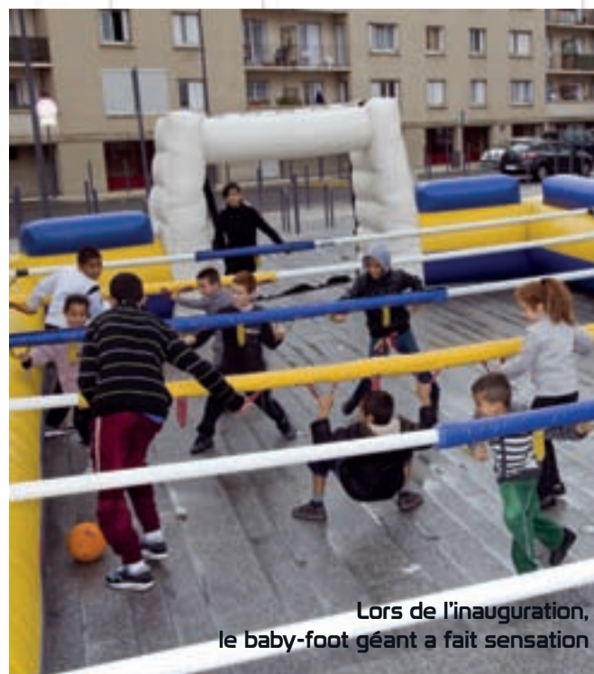
Lors de l'inauguration, le baby-foot géant a fait sensation

La Ville a créé un beau quartier, le plus beau de la commune. C'est à nous commerçants de le rendre attractif, de le faire vivre. Avec l'esthéticienne, la supérette, la boulangerie, la brasserie-tabac et l'auto-école, nous formons une belle équipe et œuvrons dans l'intérêt commun. Nous voulons créer des animations commerciales, des événements sympas pour dynamiser notre secteur. Nous sommes bien épaulés par la Ville.