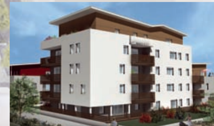
Immeuble Très haute performance énergétique (THPE) « Les Tanneurs » : 17 logements en locatif social (SCIC Habitat) répartis sur 4 étages + rez-de-chaussée. Typologie : 4 T2 ; 5 T3 ; 5 T4 ; 3 T5. Appartements accessibles aux personnes à mobilité réduite.