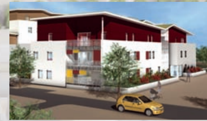
Immeuble Très haute performance énergétique (THPE) « Les Gantières » : 15 logements en locatif social (SCIC habitat) répartis sur 2 étages + rez-de-chaussée. Typologie : 3 T2 ; 6 T3 ; 6 T4. Appartements accessibles aux personnes à mobilité réduite.